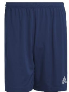
PANTALONE ESTIVO DI ALLENAMENTO

TAGLIA BAMBINO: € 9,89 TAGLIA ADULTO: € 11,00