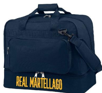
BORSONE DI RAPPRESENTANZA

TAGLIA BAMBINO: € 45,99 TAGLIA ADULTO: € 51,50