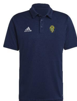
MAGLIA ESTIVA DI RAPPRESENTANZA

TAGLIA BAMBINO: € 16,51 TAGLIA ADULTO: € 22,01