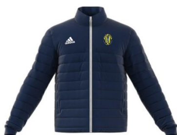
GIUBOTTO AUT./PRIM. DI RAPPRESENTANZA

TAGLIA BAMBINO: € 35,00 TAGLIA ADULTO: € 40,50