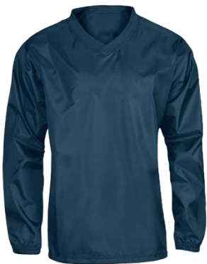
K-WAY ANTIPIOGGIA DI ALLENAMENTO

TAGLIA BAMBINO: € 8,26 TAGLIA ADULTO: € 9,89