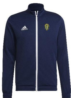
GIACCA TUTA DI RAPPRESENTANZA

TAGLIA BAMBINO: € 18,49 TAGLIA ADULTO: € 21,25