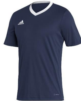
MAGLIA ESTIVA DI ALLENAMENTO

TAGLIA BAMBINO: € 16,51 TAGLIA ADULTO: € 22,01