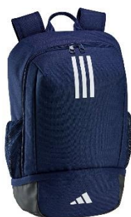
ZAINO DI RAPPRESENTANZA

TAGLIA BAMBINO: € 35,00 TAGLIA ADULTO: € 40,50