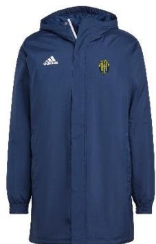
GIUBOTTO INVERNALE DI RAPPRESENTANZA

TAGLIA BAMBINO: € 8,26 TAGLIA ADULTO: € 9,89