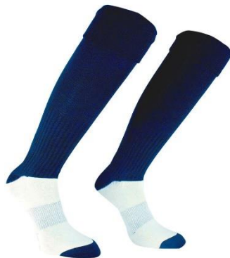
CALZETTONI TECNICI DI ALLENAMENTO

TAGLIA BAMBINO: € 3,22 TAGLIA ADULTO: € 3,22