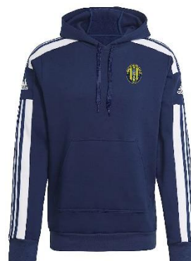
GIACCA INVERNALE DI RAPPRESENTANZA