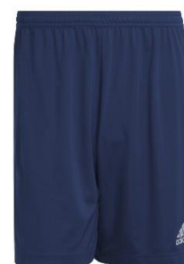
PANTALONE ESTIVO DI RAPPRESENTANZA

TAGLIA BAMBINO: € 14,65 TAGLIA ADULTO: € 15,75