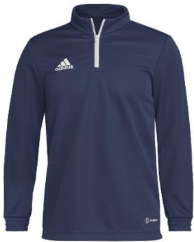
GIACCA TUTA DI ALLENAMENTO

*E' facoltativo l'acquisto del materiale sotto riportato, tuttavia i ragazzi devono venire ad allenamento con divisa completamente in blu fac-simile a quella sotto riportata